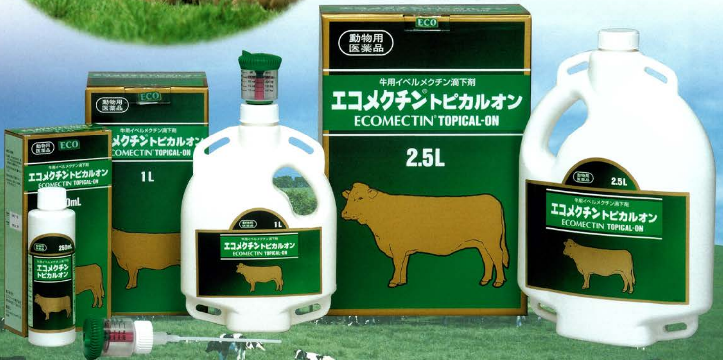
包装：左から順に 250mLポリエチレンボトル、1Lポリエチレンボトル、2.5Lポリエチレンボトル

牛には消化管内に線虫類、体表面にはダニ類など、さまざまな寄生虫がいます。とくに放牧牛はこれらの寄生虫に感染しやすい環境で飼育されていて、感染率は舎飼い牛よりも高い傾向が見られます。寄生虫対策は増体や産乳量、繁殖成績の改善などの生産性を高め、経済性の改善も期待が望めます。たいせつな牛の寄生虫対策にイベルメクチン0.5%含有の滴下剤で、牛の内・外部寄生虫駆除剤「エコメクチン®トピカルオン」を、ぜひどうぞ。姉妹品に注射剤「エコメクチン®注射液1%」もございます。用途に合わせてご利用ください。